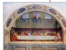
Last Supper Andrea del Sarto (1527).