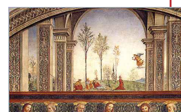
Last Supper Pietro Vannucci, detto il Perugino, e bottega(1495 ca.).