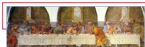
Last Supper by Francesco di Cristofano, detto il Franciabigio (1514)