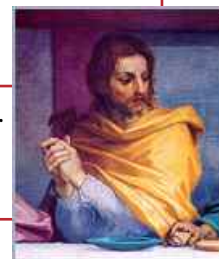
Last Supper Andrea del Sarto, particolare (1527).