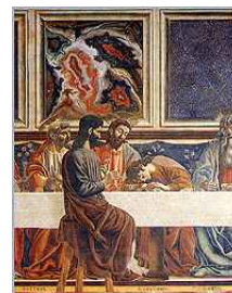
Last Supper Andrea Del Castagno (1450 ca.).

Cenacolo di San Michele a San Salvi , già monastero di San Michele a San Salvi, attuale Museo, via di San Salvi n. 16, Ultima Cena di Andrea del Sarto (1527).